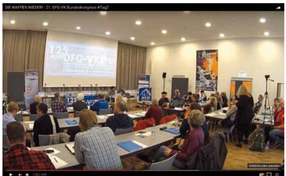
Standbild aus einem Videoclip über den DFG-VK-Bundeskongress - abrufbar über den Youtube-Kanal der DFG-VK ( www.youtube.com )

Militär ist in der heutigen Politik teilweise zum Selbstzweck geworden: Durch die immerwährenden gegenseitigen Drohungen mit militärischer Macht erhält sich das System selbst aufrecht. Dieser Kreislauf muss durchbrochen werden, um nicht auszudenkendes menschliches Leid zu verhindern. Seit 125 Jahren engagiert sich unsere Organisation gemeinsam mit vielen anderen für Frieden – hätten diese warnenden Stimmen Gehör gefunden, hätten zwei Weltkriege wahrscheinlich verhindert werden können. Wir sehen uns heute als Teil einer weltweiten Bewegung gegen Krieg und Rüstung: Frieden ist ein Menschheitsprojekt. Nur in einer friedlichen Welt lassen sich die Zukunftsprobleme der Menschheit, der Klimawandel, die Umweltzerstörung und die wirtschaftliche und soziale Ungleichheit lösen.