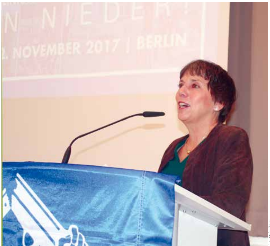
Margot Käsmann: „Das Engagement aller Mitglieder der DFG-VK wird gebraucht, heute mindestens so sehr wie in den letzten 125 Jahren.“