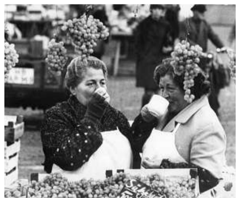
Trauben, Frost und heißer Kaffee – herbstliche Idylle auf dem Wochenmarkt.

„Nach zehnjährigem Tauziehen hat es ein kaufmännischer Angestellter aus Bremen jetzt erreicht, dass er als Kriegsdienstverweigerer anerkannt worden ist. Der Antrag wurde im Jahre 1958 gestellt und ist durch sechs Instanzen gegangen, bevor er nun vom Bundesverwaltungsgericht endgültig zugunsten des Antragstellers entschieden wurde. Vor dem Prüfungsausschuss hatte der junge Mann seinen Antrag damit begründet, er sei zu der Einsicht gekommen, dass er einen Krieg weder direkt noch indirekt unterstützen könne, weil es sein Gewissen verbiete, bei einer gewaltsamen Konfliktlösung zwischen den Staaten mitzuwirken. Auch die dazugehörige Ausbildung lehne er ab. Sowohl vom Prüfungsausschuss als auch von der Prüfungskammer als Widerspruchsbehörde und den verwaltungsgewärtlichen Instanzen wurde der Antrag abgelehnt. Auf die Revision des Klägers hin hob das Bundesverwaltungsgericht jedoch das Urteil der Vorinstanz auf. Da der Kläger inzwischen 30 Jahre alt geworden ist, kommt er außerdem für eine Ableistung des Grundersatzdienstes nicht mehr in Betracht.“ (7. November 1967)