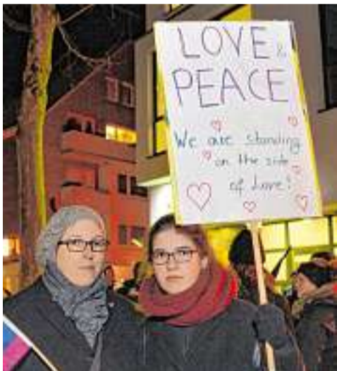
Liebe statt Hass: Etwa 150 Menschen demonstrierten gegen die jüngsten Aussagen des AfD-Politikers Björn Höcke.

Bremen. Etwa 150 Menschen haben am Donnerstagabend gegen den jüngsten Auftritt des thüringischen AfD-Landesvorsitzenden Björn Höcke demonstriert. Der hatte in einer Rede am Dienstagabend in Dresden offensichtlich mit Blick auf das Denkmal für die ermordeten Juden Europas in Berlin gesagt: „Wir Deutschen, also unser Volk, sind das einzige Volk der Welt, das sich ein Denkmal der Schande in das Herz seiner Hauptstadt gepflanzt hat“ – und damit für Empörung gesorgt. Höcke habe in seiner Rede dazu offen gegen Ausländer gehetzt, teilte die Gruppe A Gauche mit, die zu der Demo aufgerufen hatte. „Uns ist wichtig, auch in Bremen erneut klare Position gegen rechts zu beziehen“. Die Demo startete um 19 Uhr am Ziegenmarkt und zog über die Domsheide zum Marktplatz. jco