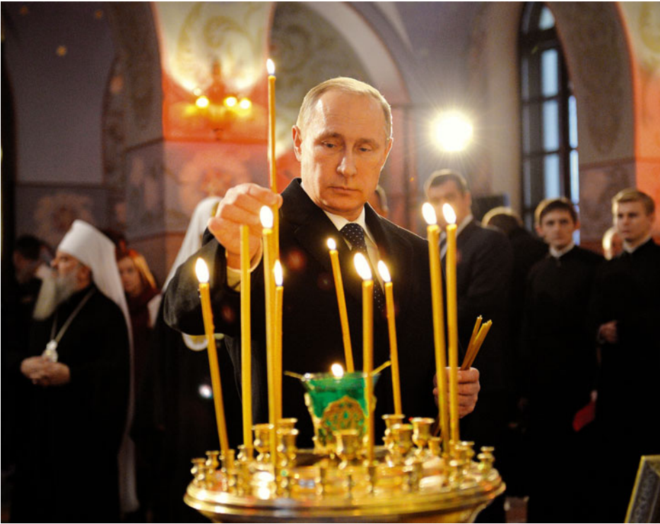
Präsident Putin in St. Petersburg: „Ich war dagegen, dass er eine dritte Amtszeit antritt“

Sowjetunion das Wort Union im Namen trug, war es ja keine wirkliche Union. Die Republiken hatten nur sehr eingeschränkte Souveränität und Zuständigkeiten. Deshalb hatte ich einen reformierten Unionsvertrag vorgelegt, der am 20. August 1991 hätte unterzeichnet werden sollen. Die Nomenklatura aber fürchtete die neue Zeit.