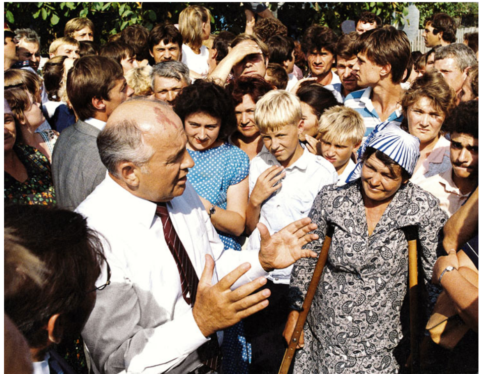
Generalsekretär Gorbatschow 1989 in seinem Geburtsort im Kaukasus: „Glasnost ist nicht tot“

Gorbatschow: Es ist schlicht nicht in Ordnung, wenn Andersdenkende unterdrückt werden. Wenn jemand wie der Antikorruptionsblogger und Politiker Alexej Nawalny unter Hausarrest gestellt wird, nur