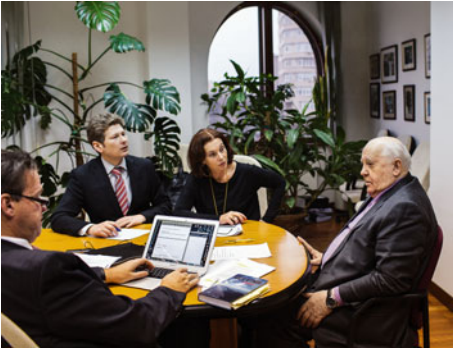
Gorbatschow beim SPIEGEL-Gespräch* „Ich bin ein glücklicher Mensch“

noch? In meinem Land ist das nicht vergessen: die ungeheuren Zerstörungen, die Frauen, die auf Männer warteten, die nie heimkehrten. Es ist gut, dass unsere Völker sich miteinander versöhnt haben.