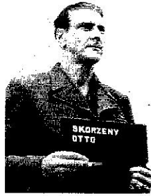
Otto Skorzeny Der SS-Mann war an der Befreiung des festgesetzten Mussolini 1943 beteiligt gewesen. Die Aufnahme zeigt ihn 1947 als Gefangenen in Nürnberg.

Ein Jahr zuvor wäre die Begeisterung Gehlens über Schnez' Angebot vermutlich größer gewesen, denn nach Ausbruch des Koreakrieges 1950 hatten Bonn und Washington erwogen, „Angehörige ehemaliger deutscher Elitedivisionen im Katastrophenfall zu sammeln, zu bewaffnen und den alliierten Verteidigungstruppen zuzuschlagen“. Inzwischen hatte sich die Lage jedoch etwas entspannt, und Adenauer war von dieser Idee abgekommen. Er setz-