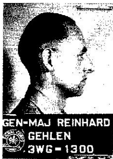
Reinhard Gehlen Der Generalmajor leitete bis 1945 die Spionageabteilung Fremde Heere Ost. Nach seiner Kriegsgefangenschaft (Foto aus seiner Akte) ließen ihn die Amerikaner den BND aufbauen.