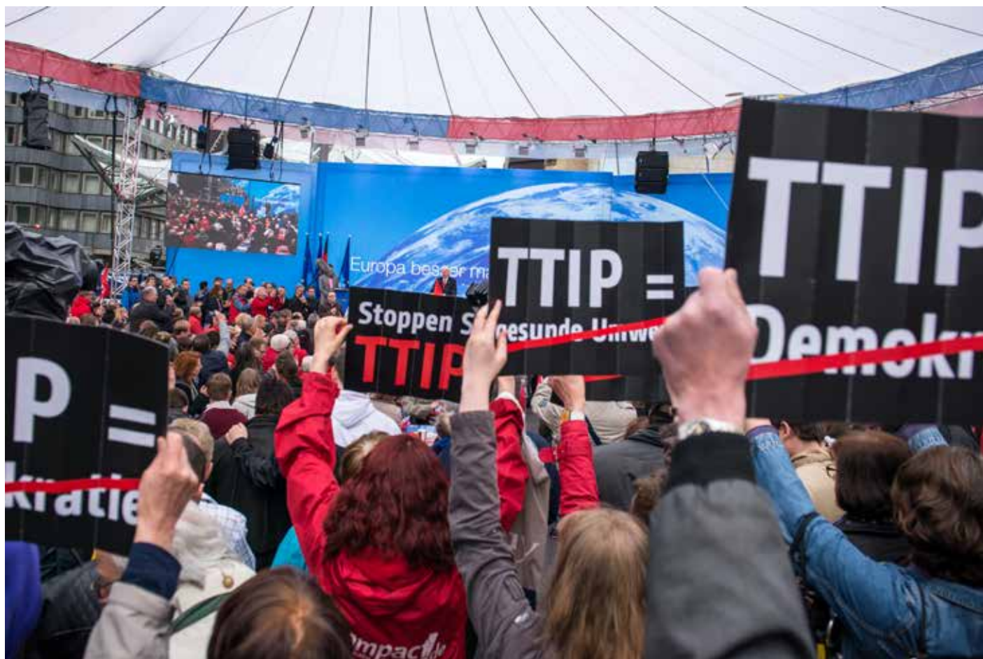
Campact TTIP-Flashmob bei dem SPD Europawahlkampf am 2.5.2014 in Dortmund mit Spitzenkandidat Martin Schulz.