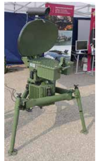
Aufklärungssystem BOR-A von Thales.

Obwohl der Wissenschaftsrat empfahl, im Zuge der Fusion zwischen FOM und IITB „die personelle Größe, die Anzahl und den Zuschnitt der Abteilungen zu prüfen und gegebenenfalls Abteilungen mit thematisch verwandten Forschungsfeldern zusammenzufassen“, 11 finden sich die meisten früheren Abteilungen in der Forschungsstruktur des IOSB wieder. Am ehemaligen Standort des wehrwissenschaftlichen FOM in Ettlingen sind weiterhin die Abteilungen für Optronik (OPT) und Szeneanalyse (SZA) angesiedelt, sowie die Abteilung für Zielerkennung,