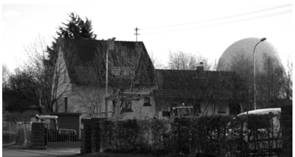
Die ehemaligen FGAN- und heutigen Fraunhofer-Institute auf dem Wachtberg bei Bonn sind durch das Radon auch aus größerer Entfernung zu erkennen.

Bei der FGAN handelte es sich zu diesem Zeitpunkt um die „ einzigste Forschungseinrichtung Deutschlands “, die „ nahezu ausschließlich wehrtechnische Fragestellungen bearbeitete “.