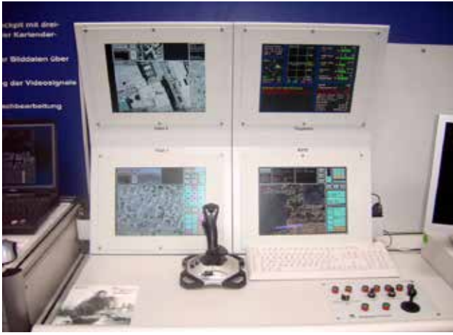
Steuerungskonsole einer LUNA-Drohne der Bundeswehr.