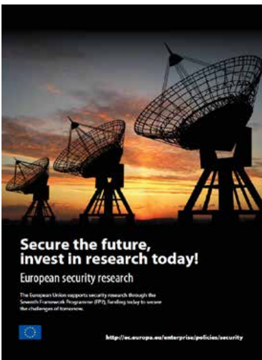
Werbung für das Sicherheitsforschungsprogramm der EU. Das BMVg wollte vorbereitet sein.

Außerdem verweist der Wissenschaftsrat auf das „7. Forschungsrahmenprogramm der Europäischen Union[, das] erstmals ein Programm zur zivilen Sicherheitsforschung enthalten [wird]. Das Programm hat eine siebenjährige Laufzeit von 2007 bis 2013 und wird voraussichtlich mit insgesamt 1.429 Mio. Euro ausgestattet sein, pro Jahr stehen also etwa 200 Mio. Euro zur Verfügung. Um an diesem Programm erfolgreich zu partizi-