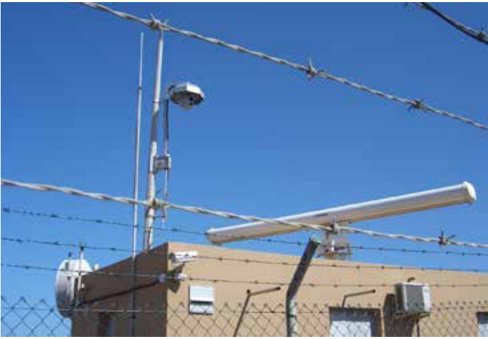
Mit Radar und Infrarot die Grenzen überwachen: Das System SIVE der spanischen Guardia Civil.

reiche Tätigkeiten entwickelt haben. So umfasste das o.g. 7. Forschungsrahmenprogramm der EU, für das sich das Verteidigungsministerium mit der Umstrukturierung der von ihm grundfinanzierten FGAN- und Fraunhofer-Institute positionieren wollte, unter der Programmlinie Sicherheitsforschung zahlreiche Projekte zur „maritimen Sicherheit“, die klar auf die Überwachung der EU-Außengrenzen abzielten, darunter AMASS und WIMAAS , an denen auch das IOSB beteiligt war. AMASS ( Autonomous Maritime Surveillance System ) zielte unter Leitung der Rüstungssparte der Carl Zeiss AG (Carl Zeiss Optronics GmbH, 2011 von Cassidian und mittlerweile von Airbus übernommen) in Zusammenarbeit mit den Streitkräften Maltas auf die Entwicklung von Bojen, die „ausgerüstet mit den modernsten akustischen und optischen Sensoren“ eigenständig kleine und mittlere Boote klassifizieren sollen, „den Behörden beispiellose Überwachungsfähigkeiten liefern und sie befähigen soll, schnell die angemessenen Handlungen durchzuführen“. 36 Die Bebilderung der Broschüren und der Webseite des Projekts lässt dabei keinen Zweifel aufkommen, dass es hierbei primär um die Bekämpfung illegalisierter Migration geht, wie sie gegenwärtig v.a. vom Mittelmeer bekannt ist und dass die Bildverarbeitung und Mustererkennung, die das IOSB hierzu beisteuert, v.a. auf die Detektion sog. Flüchtlingsboote abzielt.