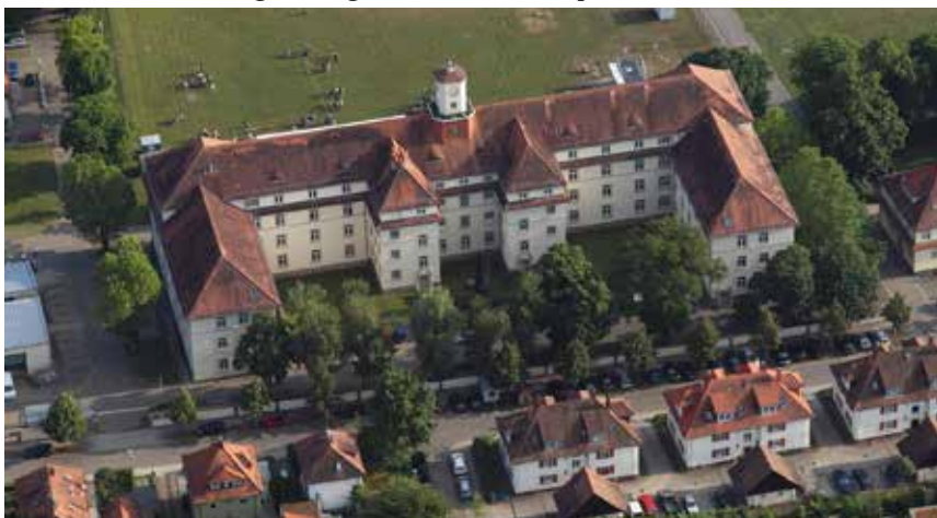
Sitz des Fraunhofer IOSB (früher FOM) in Ettlingen.

In einem zweiten Schritt wird anhand der aktuellen Arbeit des Fraunhofer IOSB dargestellt, dass dieses weiterhin eine starke militärische Prägung aufweist und eng mit Rüstung, Bundeswehr und NATO verwoben ist. Zugleich konnte das IOSB, wie von der Bundeswehr vorgesehen, umfangreich an der „zivilen“ Sicherheitsforschung partizipieren. Dies gilt v.a. für Projekte zur Grenzüberwachung bzw. „maritimen Sicherheit“, die jedoch gerade in Zeiten asymmetrischer Kriegführung starke Parallelen zu militärischer Aufklärung und dem Konzept der „Netzwerkzentrierten Kriegführung“ aufweisen. Entsprechend kann