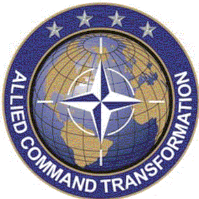
Das Allied Command Transformation Abzeichen der Nato.

Neben den an Exzellenzzentren beteiligten Nationen und Orga-