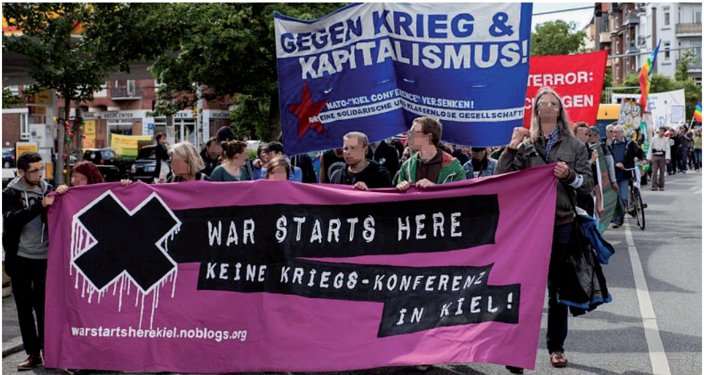
Proteste bei der Kieler Woche.

in den letzten Jahren auch zunehmend in der deutschen Außenpolitik. Zwar liegt der Ursprung dessen nicht in den Nato-Exzellenzzentren, aber sie erweisen sich als Förderer einseitiger militärischer Ideologie, die in außenpolitischen Fragen das Primat des Militärischen vertritt, das durch zahlreiche Veranstaltungen an Politik und Zivilgesellschaft herangetragen und mittels strategischer Kommunikation auch zunehmend in den medialen Diskurs gebracht wird.