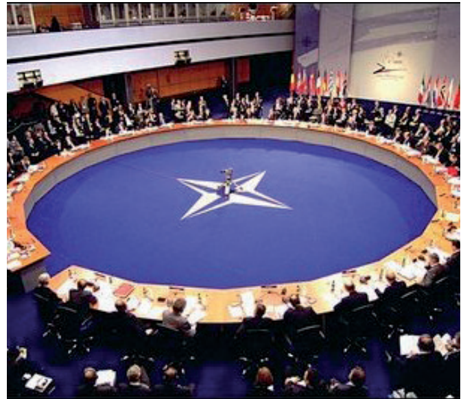
Nato-Gipfeltreffen in Prag im Jahr 2002.

Im Rahmen ihres Gipfeltreffens in Prag 2002 beschlossen die Nato-Staaten die Neuausrichtung der Nato-Kommandostruktur und die fortlaufende Transformation der Allianz. Ziel war es u. a., die Nato zu einer flexibleren Interventionsstreitmacht auszubauen, um besser auf die neuen „Bedrohungen“ des 21. Jahrhunderts reagieren zu können und im Zuge dessen die Nato-Kommandostruktur deutlich zu verschlanken. 4 Bereits nach dem Zerfall der Sowjetunion war es zu einer Straffung der Kommandostruktur gekommen, im Rahmen derer die Anzahl der Nato-Hauptquartiere von 78 auf 20 reduziert worden war. Infolge des Gipfeltreffens 2002 wurden die bisherigen Nato Oberkommandos in Europa (Allied Command Europe) und den USA (Allied Command Atlantic) im Alliierten Kommando Operation (Allied