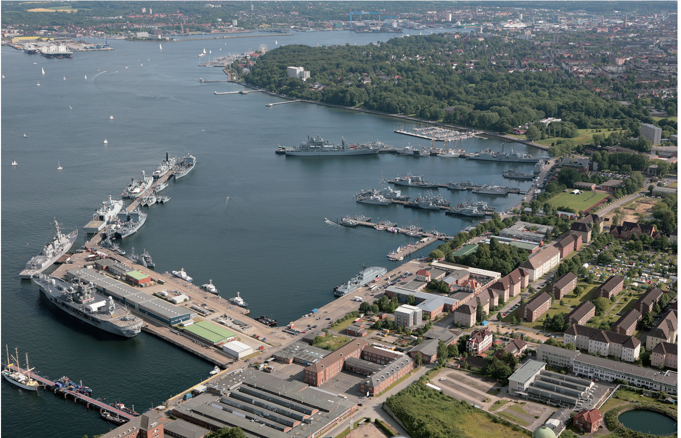
Der Marinestützpunkt in Kiel.

zur Einstellung der Bevölkerung zeigten demnach, dass insbesondere in Deutschland große Vorbehalte gegenüber dem Einsatz der Luftwaffe bestehen (im Unterschied zu den USA und Großbritannien), ein Umstand, der darauf zurückgeführt wird, dass pazifistische Überzeugungen in Deutschland infolge des Zweiten Weltkrieges besonders ausgeprägt sind: „[...] die Deutschen sind deutlich empfänglicher für Desinformations-Kampagnen und anti-militärische Kampagnen als die meisten anderen NATO-Nationen.“ 39 Ausgehend von der Problematik mangelnder Unterstützung, werden Vorschläge gemacht, wie die Kommunikation von Kriegseinsätzen verbessert werden kann, um deren Akzeptanz zu erhöhen und gegnerischen „Falschinformationen“ offensiv entgegenzuwirken.