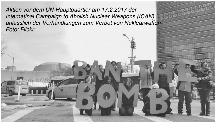
Aktion vor dem UN-Hauptquartier am 17.2.2017 der International Campaign to Abolish Nuclear Weapons (ICAN) anlässlich der Verhandlungen zum Verbot von Nuklearwaffen

Der Beitrag erschien zuerst in der Zwewochenschrift Ossietzky