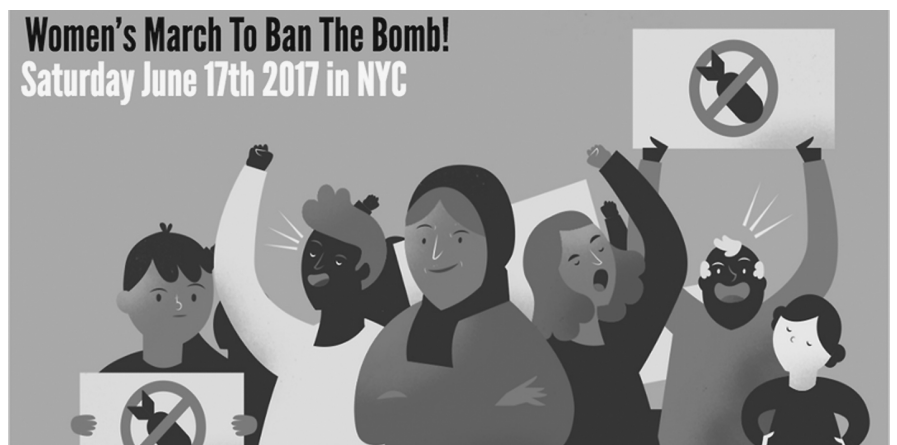
Grafik der Women's International League for Peace & Freedom

Diese Bewegung ist dabei, sich zu entwickeln. Richtiger ist, von Bewegungen zu sprechen. Sie sind im Kern, auch wenn das die Mehrheit der jetzt aktiv werdenden Menschen vielleicht noch nicht so sieht: antiimperialistisch, antioligarchisch. Ich scheue mich noch, das Wort antikapitalistisch zu benutzen. Diese Bewegungen sind ermutigend, aufmunternd. Sie brechen die Resignation und Verzweiflung nach Trumps Wahlsieg auf. Zu hoffen ist,