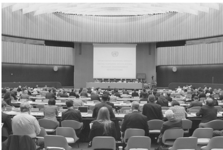
Sitzung der UN-Arbeitsgruppe Nukleare Abrüstung im Mai 2016

von Thomas Roithner, Politikwissenschaftler, Wien