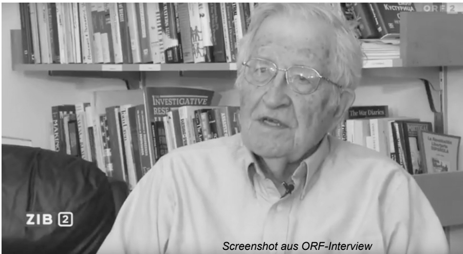
Screenshot aus ORF-Interview