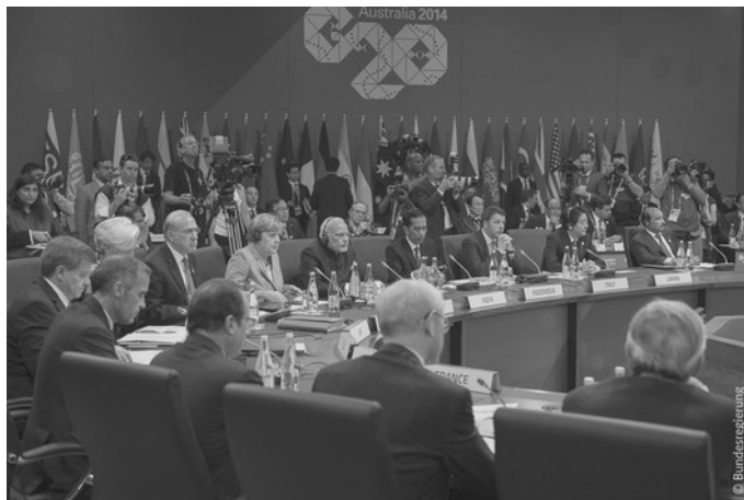
G20-Treffen 2014 in Australien

zwischen den imperialistischen Staaten aus. Genauer vom deutschen Kanzler Helmut Schmidt und vom französischen