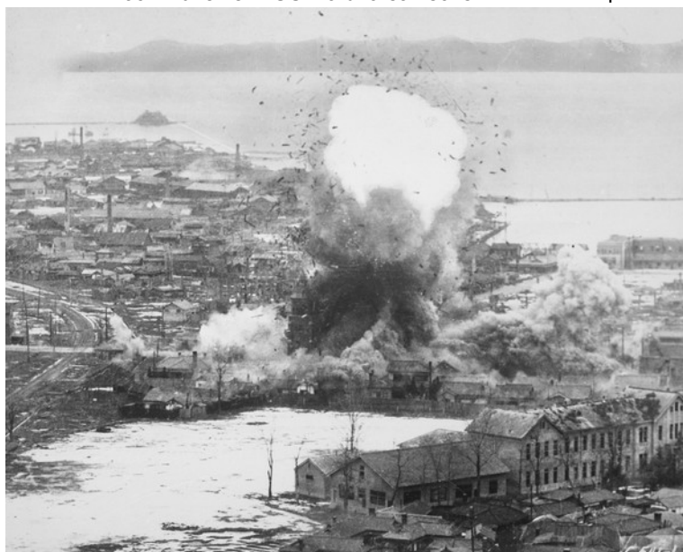
Fliegerbomben zerstören Lager- und Hafenanlagen in Nordkorea (1951)

Seit dem Tod von Kim Jong Il 2011 übernahm sein Sohn Kim Jong Un die