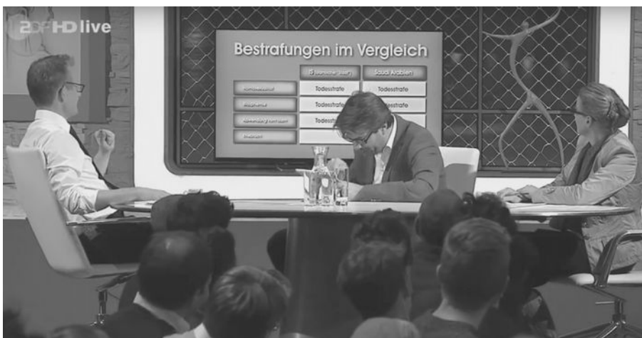
Sketch zu PR-Maßnahmen für Saudi-Arabien aus der ZDF-Satiresendung „Die Anstalt“ vom 8.12.2015 (Screenshot)

Die Beteiligung des Finanzfonds der katarischen Regierung an Firmen wie Porsche und an Luxemburger Banken führt sicher zu wechselseitigen wirtschaftlichen Interessen und daraus resultierenden Rücksichtnahmen. Die Feudalherren am Golf sind nicht nur wichtige Kunden im Rüstungsgeschäft, sondern auch finanzkräftige Teilhaber. Ich meine, es sollte nicht nur der Rüstungsexport an den arabischen Golf gestoppt werden, auch die wirtschaftliche Zusammenarbeit mit den Terrorpaten sollte stigmatisiert werden. Auch der Sport kann jedoch eine wichtige Rolle für einen gesellschaftlichen Wandel auf der arabischen Halbinsel spielen. Der Emir von Katar setzt gezielt den Sport ein, um für sein Regime zu werben. Die Aspire Sports Academy in Doha ist eine der weltweit größten Trainings- und Wettkampfstätten für Spitzensportler. In Katar werden Tischtennis-, Box- und Motorradweltmeister-