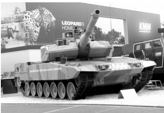
Foto: Leopard 2A7+ auf der Waffenmesse Eurosatory

Die Kriege in Libyen und Syrien ebenso wie der Konflikt in der Ukraine haben die Geschäfte mit dem Tod wieder befeuert. Die Entwicklung neuer Waffensysteme lohnt aber für die Rüstungsindustrie nur, wenn sie anschließend große Stückzahlen herstellen und exportieren kann. Besonders günstig für das Geschäft mit dem Krieg ist die Bewahrung von Waffen im Einsatz. Krieg belebt das Geschäft. Auf Rüstungsmessen ist „Combat Proven“