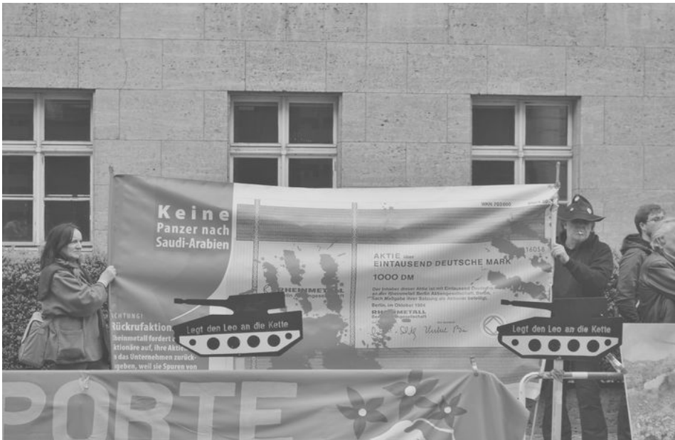
„Leo an die Kette“: Protest vor Hauptversammlung Rheinmetall am 14.5.2013

aber schnell klar, dass es ein ständiges Auf und Ab gibt. 2015 wurden Einzelausfuhrgenehmigungen über 3,97 Mrd. und für die weniger transparenten Sammelausfuhrgenehmigungen von 2,55 Mrd. € erteilt. Zusammen gerechnet sind das Genehmigungen für Waffenexporte von 6,4 Mrd. €.