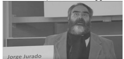
Screenshot aus Video-Mitschnitt