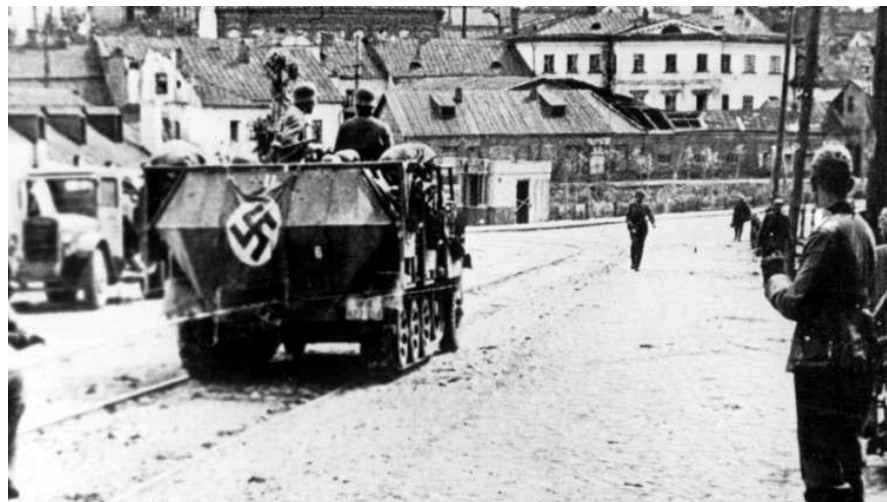
Ein Panzerfahrzeug der Wehrmacht, gefolgt von Soldaten auf Motorrädern, in der Stadt Minsk während des Rußland-Feldzuges im August 1941.