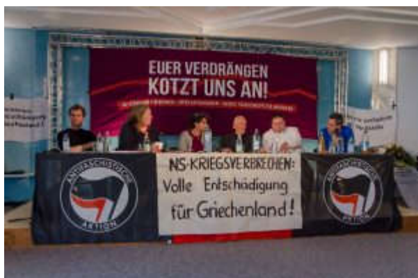
Podium des Hearings »NS-Verbrechen benennen | Opfer entschädigen | Rechte Traditionspflege angreifen« am 14. Mai in Bad Reichenhall.