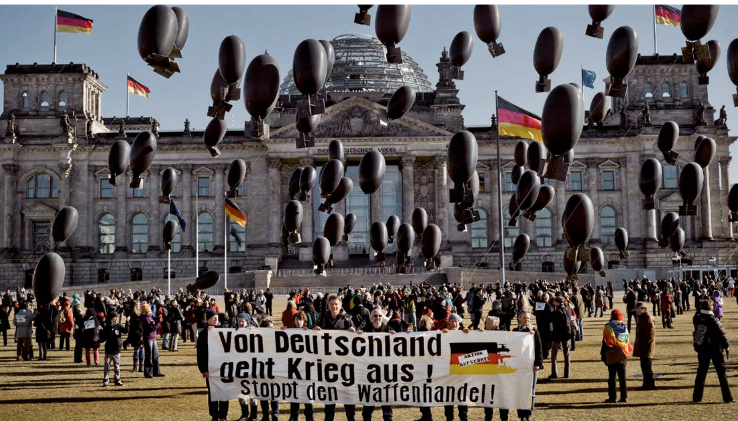
Protestaktion vor dem Reichstag der „Aktion Aufschrei - Stoppt den Waffenhandel“, einem Bündnis von über 100 Organisationen aus Zivilgesellschaft und Kirchen

tischen Grundsätze der Bundesregierung für den Export von Kriegswaffen und sonstigen Rüstungsgütern“ (2000), der „Gemeinsame Standpunkt des Rates der EU betreffend gemeinsame Regeln für die Kontrolle der Ausfuhr von Militärtechnologie und Militärgütern“ (2008) sowie der Vertrag über den Waffenhandel ATT (2014), mit dem sich die Bundesregierung verpflichtet hat, Waffen nicht zu exportieren, wenn damit Kriegsverbrechen begangen werden können – wozu auch der Einsatz von Kindersoldaten gehört (Art. 6 ATT). Bei hinreichendem Verdacht, dass Rüstungsgüter zur internen Repression oder zu sonstigen fortwährenden und systematischen Menschenrechtsverletzungen missbraucht würden, erfolge grundsätzlich keine Genehmigung. Auf Grundlage des Leitfadens zur Anwendung des „Gemeinsamen Standpunkts“ werde bei der Prüfung, ob das Endbestimmungsland die Menschenrechte und das humanitäre Völkerrecht achtet, auch berücksichtigt, „ob im Empfängerland ein Mindestalter für die Rekrutierung zum (freiwilligen und obligatorischen) Wehrdienst festgelegt sowie gesetzliche Maßnahmen getroffen worden sind, mit denen die Rekrutierung von Kindern und deren Einsatz bei Feindseligkeiten untersagt und geahndet werden“. 110