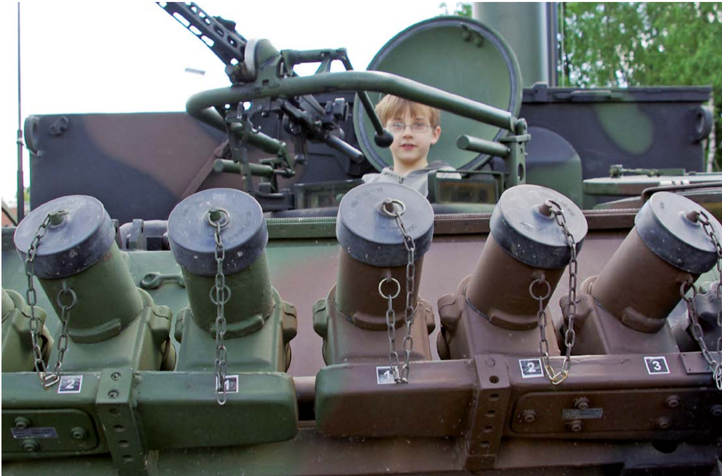
Kinder dürfen bei Bundeswehr-Veranstaltungen in Panzer oder Hubschrauber steigen

Gerade auch auf Jugendliche ausgerichtet sind zudem die von der Bundeswehr produzierten YouTube-Serien. Der Wehrbeauftragte bewertet in seinem Bericht 2017 zwar die YouTube-Serie „Die Rekruten“, bei der 12 neue Rekrutinnen und Rekruten während ihrer Grundausbildung mit der Kamera begleitet wurden, als positiv. Sie erlaube potenziellen Bewerberinnen und Bewerbern einen ersten Blick auf die Bundeswehr. Körperliche Anstrengungen, Entbehrungen und der Umgang mit Waffen, auch die Erfahrung von Kameradschaft könnten in dieser Form anschaulicher und besser vermittelt werden, als dies in Hochglanzbroschüren möglich wäre. 65 Doch lässt sich kritisch fragen, ob in solchen vier- bis 13-minütigen Videos die Realität wirklich eingefangen und nicht zum Zwecke der – und sei es auch nur indirekten – Werbung für die Bundeswehr doch erheblich trivialisiert und beschönigt wird.