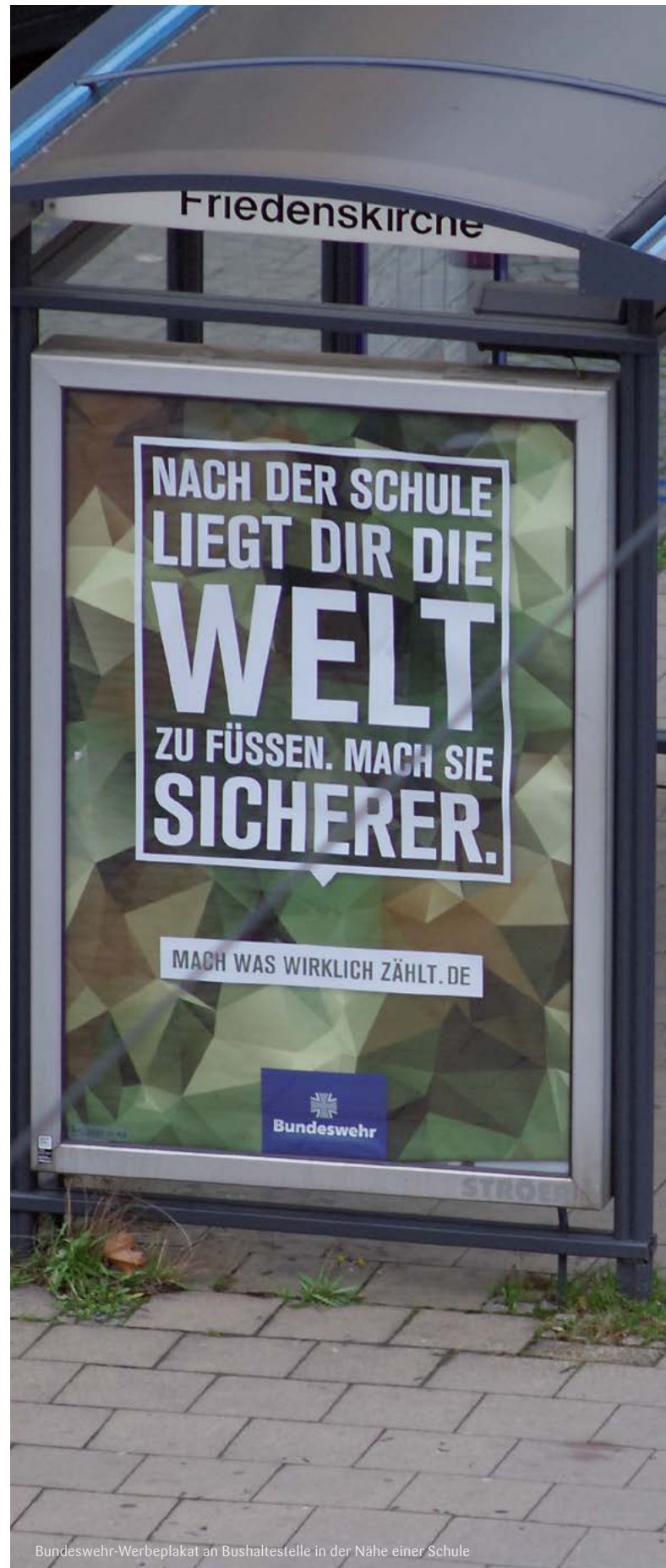
Bundeswehr-Werbepplakat an Bushaltestelle in der Nähe einer Schule

Umgekehrt weist der Wehrbeauftragte aber auf – 63 (2016), 167 (2017) und 150 (2018) – gemeldete Vorfälle in der Kategorie „Verdacht auf Gefährdung des demokratischen Rechtsstaates, unzulässige politische Betätigung und Volksverhetzung“ hin. Vorwiegend handle es sich hierbei um Propaganda-Delikte wie ausländerfeindliche und antisemitische Äußerungen, das Hören rechtsextremistischer Musik, Hakenkreuzschmierereien, das Zeigen des verbotenen „Deutschen-Grußes“, „Sieg-Heil“-Rufe sowie die Nutzung gespeicherter Bilder, Texten oder Musik mit extremistischen Inhalt. 49 Sofern diese Vorkommnisse gemäß dem Grundprinzip der Inneren Führung nicht konsequent gemeldet, geahndet und unterbunden werden, setzt dies gerade minderjährige Soldatinnen und Soldaten einem erheblichen Meinungsdruck aus – und beeinträchtigt die Persönlichkeitsentfaltung im Geiste der in der Charta der Vereinten Nationen und der Kinderrechtskonvention verkündeten Ideale. Generell stellt sich die Frage, ob im Rahmen einer militärischen Ausbildung das Recht auf Bildung im Geiste von Frieden, Toleranz und Freundschaft zwischen den Völkern stets gewährt werden kann.