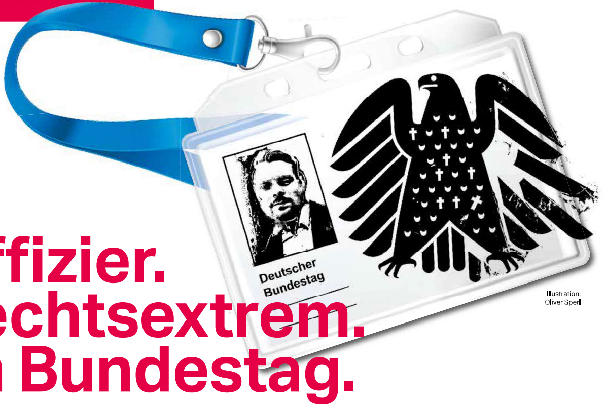
Illustration: Oliver Spertl