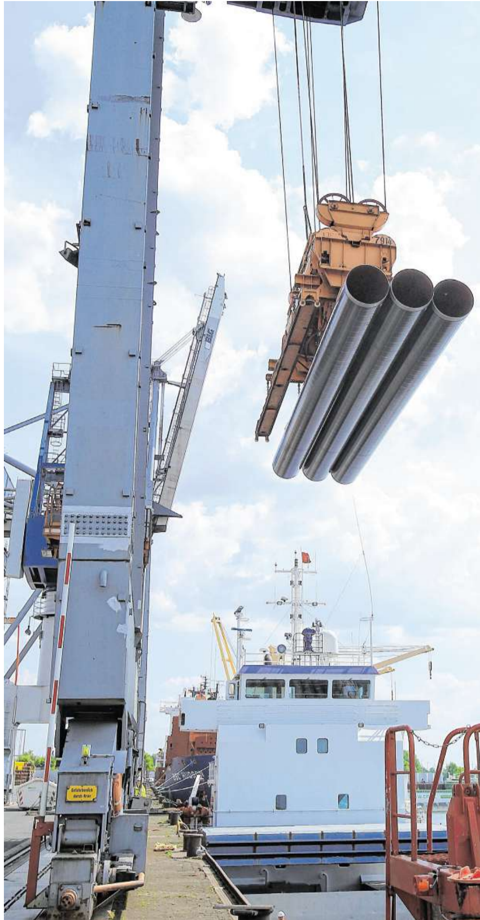
Güterumschlag am BLG-Terminal im Neustädter Hafen. Eine Landesbeteiligung am Logistiker ist aus Sicht der FDP verzichtbar.

Dem Liberalen Volker Redder gehen solche Überlegungen grundsätzlich gegen den Strich. Beteiligungen der öffentlichen Hand an Unternehmen „sind immer mit Risiken behaftet“, ist Redder überzeugt. Für das kleinste Bundesland gelte zudem, dass in den nächsten Jahren enorme Summen benötigt werden, um den Sanierungsstau in der öffentlichen Infrastruktur zu beseitigen. „Wo soll dieses Geld denn herkommen?“, fragt der Wirtschaftsdeputierte. Die zusätzlichen Einnahmen aus Berlin, die Bremen ab 2020 erwarten könne, seien auf mittlere Sicht bereits weitgehend verplant. Redder: „Dann kann man sich also nur von seinem Tafelsilber trennen.“ Verkäufe heiße allerdings nicht verschern. Eine Veräußerung bremischen Eigentums sei nur zu angemessenen Preisen denkbar. Dabei gelte ein Korridor zwischen dem Zehn- und Fünfzehnfachen des Jahresgewinns eines Unternehmens als ungefähre Anhaltspunkt für den zu erzielenden Verkaufserlös. Zeitdruck, das räumt Redder ein, schwäche dabei allerdings die Verhandlungsposition des Anbieters.