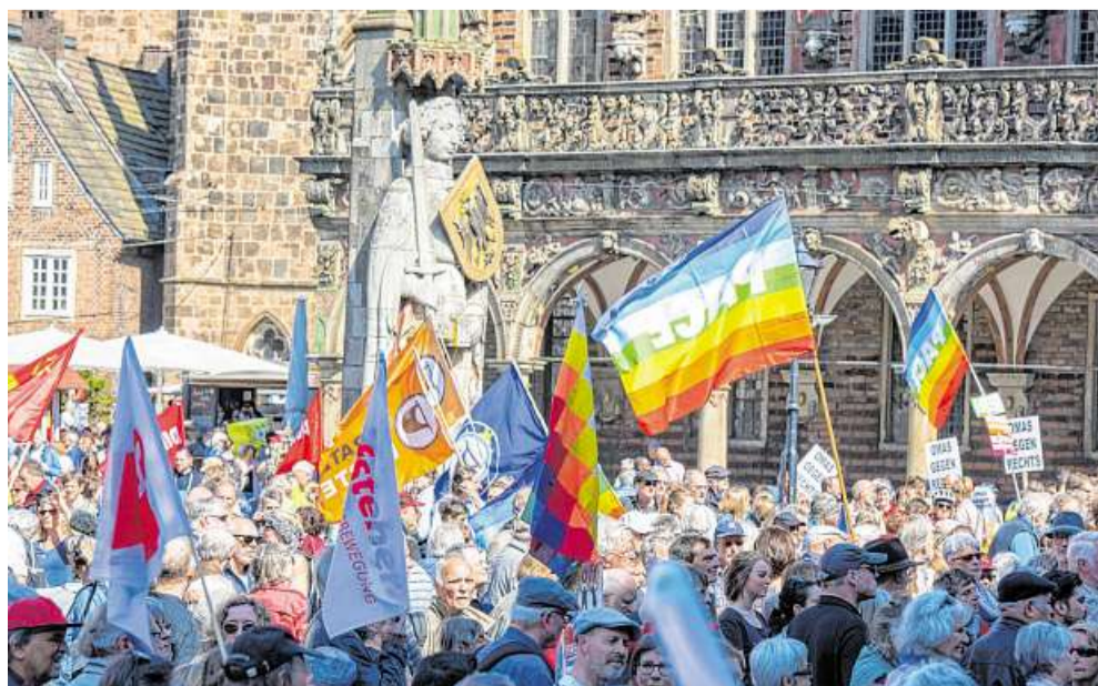
Friedensfahnen wehen auf dem Bremer Marktplatz: Zur Abschlusskundgebung des Ostermarsches haben sich am Sonnabend mehrere Hundert Menschen versammelt.

Die Tradition des Ostermarsches reicht in Bremen weit zurück: Zum ersten Ostermarsch hatten sich hier etwa 150 Aktivisten am Ostern 1960 versammelt. Damals war es nicht nur ein Demonstrationzug in der Innenstadt, sondern die Männer und Frauen marschierten vier Tage von Bremen über Verden und Fallingb. Das hielten allerdings nur rund 50 Teilnehmende durch, die meisten anderen verabschiedeten sich bereits an der Bremer Stadtgrenze.