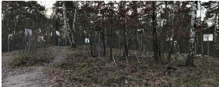
Insgesamt 100 Schilder stehen im Wald.

Mit 100 Spiegeln wird am Murellenberg in Berlin-Westend an Opfer der NS-Militärjustiz erinnert. Das Denkmal wurde jetzt attackiert. Anwohner sind entsetzt. VON SOPHIE KRAUSE UND ANDRÉ GÖRKE