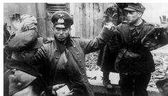
Kriegsende in Berlin: 2. Mai 1945