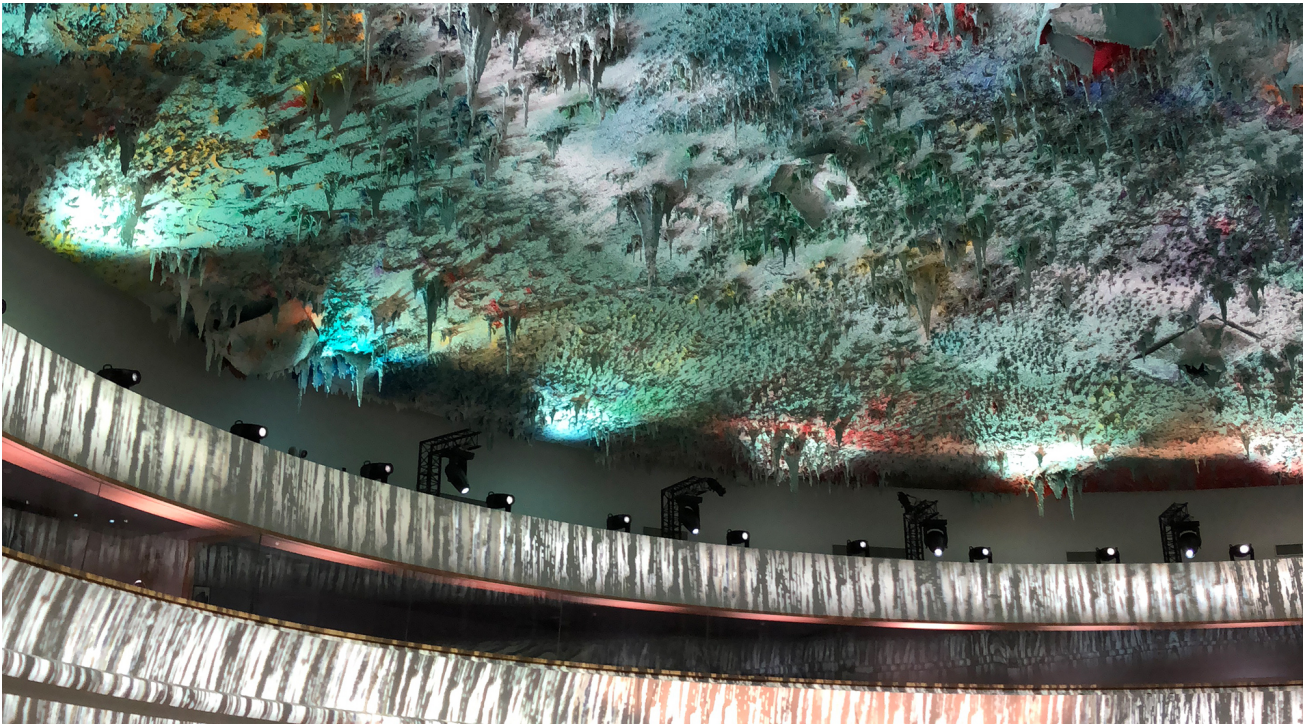
Decke des Raumes für Menschenrechte und Dialog zwischen den Zivilisationen. Vereinte Nationen Palais des Nations, Genf.

Zum ersten Mal in ihrer Geschichte hat die Menschheit ein universelles Entwicklungsprojekt beschlossen. Dieses gilt für alle Staaten und Institutionen sowie für alle Menschen. Der Slogan lautet: "Lassen wir niemanden zurück". Das Projekt ist zwar nicht verbindlich, wird aber von Zielen und Indikatoren zur Messung der Fortschritte begleitet und der Friede ist darin voll integriert.