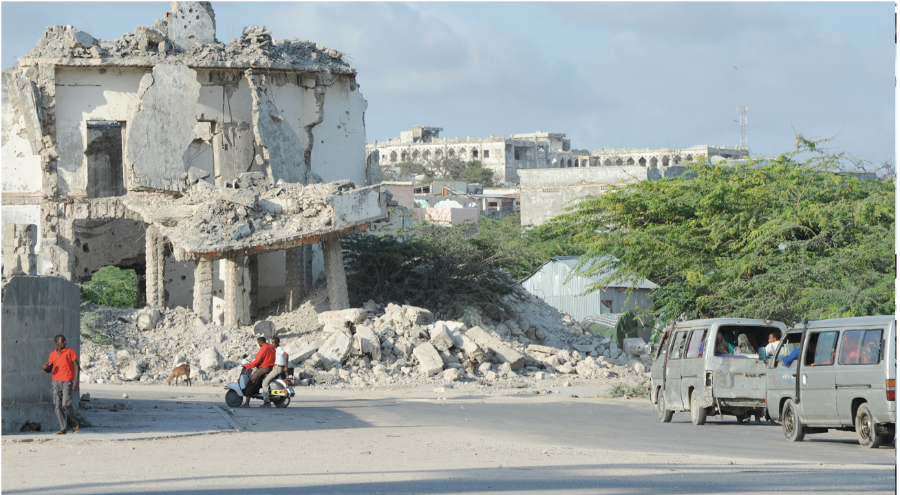
Mann auf einem Motorrad in Somalia, 2012.

“Dieser Kurs gab mir die Möglichkeit, einen fruchtbaren Austausch mit einer Reihe von erfahrenen und aufgeschlossenen Menschen in einem angenehmen Umfeld zu führen. Dadurch konnte ich mich ausserhalb des Arbeitsalltages kritisch mit meinem eigenen Tätigkeitsbereich auseinandersetzen.”