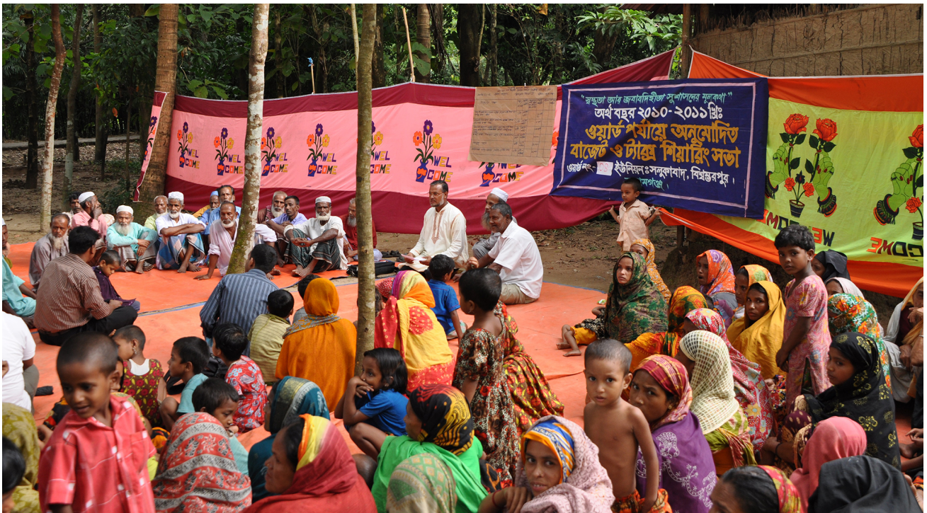
Lokale Planung und lokale offene Budgetierung in Bangladesch.

Das SDG 16 ist ein grosser Durchbruch in Bezug auf die Anerkennung von Gouvernanz für eine integrative und nachhaltige Entwicklung. Dies zeigt sich durch die Betonung effektiver und rechenschaftspflichtiger Institutionen und integrativer Entscheidungsfindung auf allen Ebenen, ebenso wie durch die Ziele Rechtsstaatlichkeit, Korruptionsbekämpfung und Zugang zu Informationen. Für die DEZA sind dies bedeutende thematische Prioritäten.