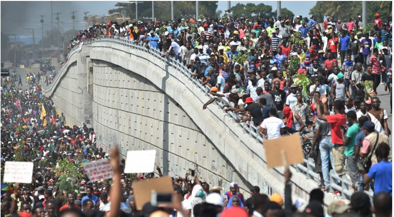
Demonstrationen in Port-au-Prince, Februar 2019.

Der Sturz von Duvalier 1986 und die Annahme der Verfassung von 1987 markierten den Beginn einer neuen politischen Ära in Haiti: der Demokratie. Allerdings hapert das Unterfangen, denn die Verfassung übernimmt zwar die Schlüsselbegriffe einer Demokratie, doch Korruption und eine mangelnde Berücksichtigung der Bedürfnisse der Bevölkerung behindern deren Umsetzung. Es ist daher nicht übertrieben zu sagen, dass der 1986 begonnene Übergang zu soliden demokratischen Institutionen in Haiti noch immer nicht gelungen ist.