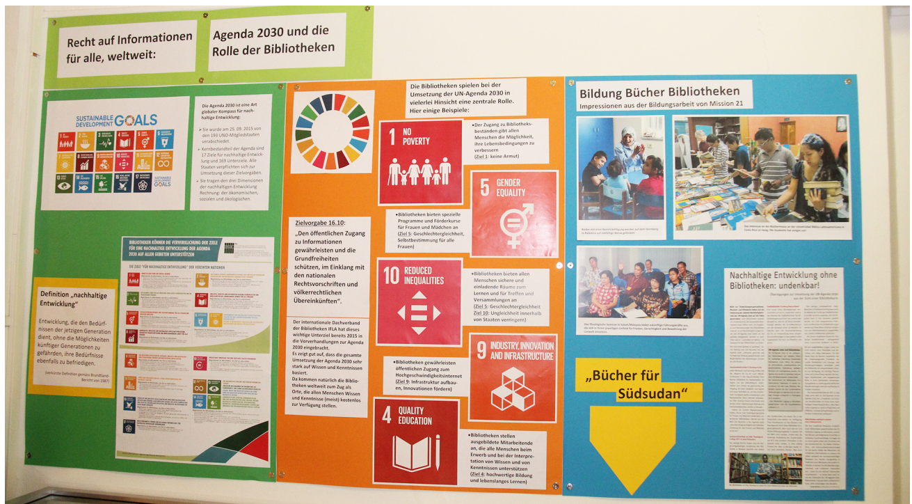
Kleine Ausstellung zum Thema „Agenda 2030 und Rolle der Bibliotheken“ im Eingangsbereich zur Bibliothek.

Soll die Umsetzung der UN-Agenda 2030 Erfolg haben, müssen sich Menschen überall auf der Welt ungehinderten Zugang zu Wissen und Informationen beschaffen können. Bibliotheken weltweit spielen dabei eine Schlüsselrolle. Die Fachbibliothek von Mission 21 hat sich Ziel 16 auf die Fahnen geschrieben.