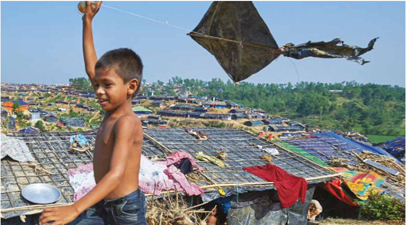
Titelbild des Berichts. Foto: Paul Jeffrey, Cox's Bazar

Jahrelang mussten wir eine weltweite Schwächung der grundlegenden Bürgerrechte mitansehen: Die Meinungs-, Versammlungs- und Pressefreiheit wird in vielen Ländern zunehmend eingeschränkt. Als Reaktion darauf hat HEKS zusammen mit der Dan Church Aid und Bread for the World als «Act Alliance» eine Studie in Auftrag gegeben, welche die Rolle der Zivilgesellschaft bei der Erreichung der Entwicklungsziele untersucht.