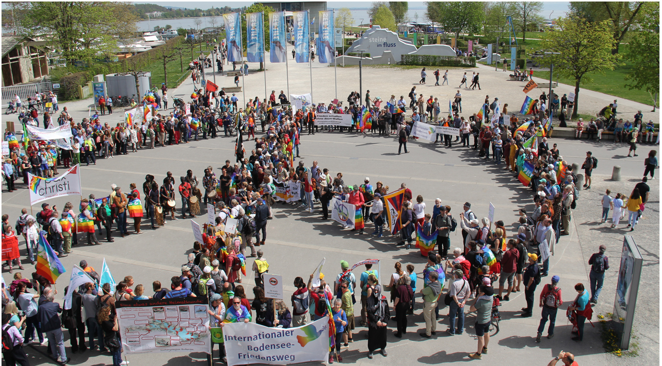
Menschen-Friedenszeichen am Friedensweg 2019 Kreuzlingen.

Beim SDG 16 zum Thema Frieden wird wohl in einmaliger Klarheit deutlich, dass die Agenda 2030 unter Regierungen ausgehandelt worden ist mit einer klaren “Beisshemmung” in Bezug auf friedenspolitische Forderungen. Sicherheitspolitik, Armee und Rüstungspolitik sind auch im Rahmen der UNO Ausdruck der staatlichen Souveränität. So finden sich keine Forderungen zu Rüstungsbeschränkung, Abrüstung oder nur schon Rüstungskontrolle. Nicht einmal der universale Beitritt zu den Abkommen zum Verbot geächteter Waffen oder etwa des Waffenhandelsvertrags (ATT) wird gefordert. In Punkt 16.4. wird einzig verlangt: «Bis 2030 illegale Finanz- und Waffenströme deutlich verringern» (nicht etwa unterbinden).