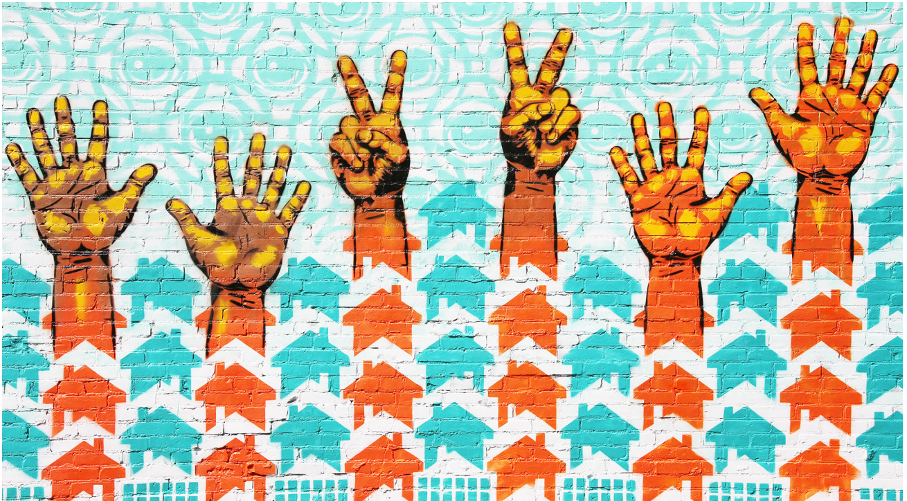
Hands Up for Peace, Street Art Missouri, USA. Creative Commons

Im KOFF Jahresbericht 2018 zeigen die einzelnen Artikel, wie KOFF konkret zur Friedensförderung beiträgt. Die Antworten erhielten wir dank Interviews mit Vertreterinnen und Vertretern von KOFF Trägerorganisationen, mit denen KOFF im Jahr 2018 eng zusammengearbeitet hat.