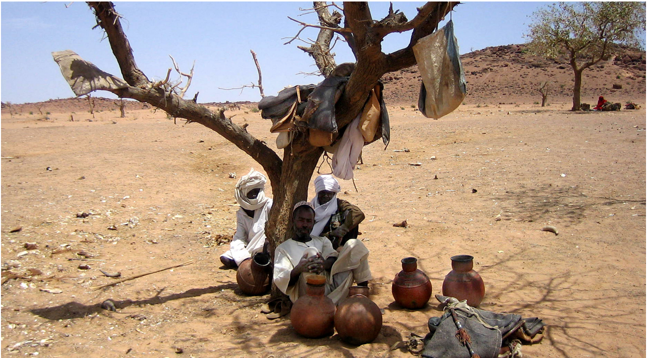
Hirten schützen sich unter einem Baum im Tschad vor der Sonne.

Nichts zerstört Lebensgrundlagen und Wirtschaft so sehr wie gewalttätige Konflikte – ausser vielleicht Umweltkatastrophen. Entwicklung, Frieden und Umwelt sind deshalb untrennbar miteinander verbunden.