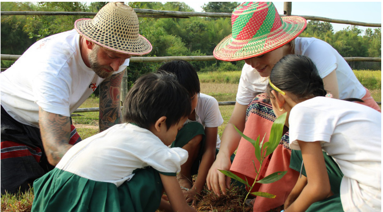
Grüne Schule Myanmar.

Die zunehmenden Wetterextreme infolge des Klimawandels verursachen weltweit unvorstellbare Schäden. In Myanmar, einem der von Naturkatastrophen am häufigsten und stärksten betroffenen Länder, sterben tausende Menschen an den Folgen der Unwetter durch Seuchen und Hunger. Nebst der Ausbeutung der natürlichen Ressourcen, insbesondere der grassierenden Entwaldung, kämpft das Land gegen unsachgerechte Abfallentsorgung. Infolge langjähriger politischer und wirtschaftlicher Isolation des Landes, hat die zunehmende Verarmung die Gesellschaft sozial und ethnisch zersplittert. Auch in dieser Region verfolgt die Stiftung Kinderdorf Pestalozzi mit ihren Projekten die Verwirklichung der SDG 2030. Vor Ort fördert sie tragfähige Lebensgrundlagen und unterstützt entwurzelte Bevölkerungsgruppen. Ihr Fokus liegt auf zukünftigen Generationen, Gerechtigkeit, solidarischer Verantwortung und ist als Prävention gegen strukturelle Gewalt zu verstehen.