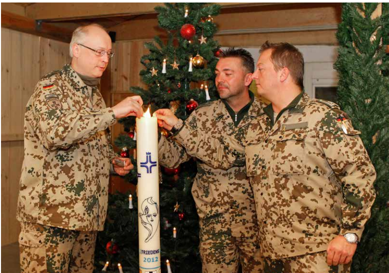
Das Team der Katholischen Militärseelsorge in Kunduz grüßt mit der Weltfriedenstagskerze aus der sanierten „Gottesburg“ zusammen mit einem Soldaten vom Dezernat der BauInfra „alle Kamerad(innen) in den Einsätzen und in der Heimat“.

Gerade das Argument, dass es nicht genug muslimische Soldat*innen gebe, verflüchtigt sich, wenn bedacht wird, dass es rein rechnerisch zu viele katholische und evangelische Militärpfarrer*innen gibt. Somit scheint die christliche Tradition im Vordergrund zu stehen und kein Handlungsbedarf für andere Religionsgemeinschaften zu bestehen. Das dies gegen das Grundgesetz ist, zeigt der dritte Artikel: „Niemand darf wegen [...] seines Glaubens, [oder] seiner religiösen [...] Anschauungen benachteiligt oder bevorzugt werden“. Neben der Religionsfreiheit in Artikel 4 verletzt die Militärseelsorge auch das Verbot der Benachteiligung anderer Religionen in Artikel 3 des Grundgesetzes, da eine Bevorzugung der christlichen Religion eindeutig vorliegt.