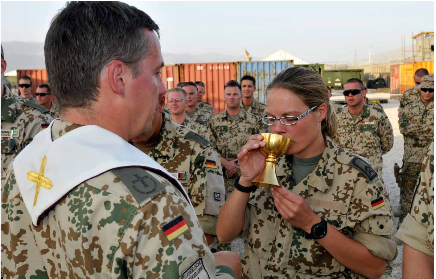
Empfang der Kommunion.

eigenen YouTube-Kanal mit eigenem Dokumentationsfilm über die Militärseelsorge. Die katholische Militärseelsorge betreibt zusätzlich noch eine eigene WebApp. Eine weitere Methode, wie Kirche und Militär gemeinsam öffentlichkeitswirksam auftreten, ist in Form von Militärmusik in Kirchen. Neben der Marschmusik gehört auch religiöse Musik zum Repertoire der Musikkorps der Bundeswehr. Bundesweit gibt es 14 Musikkorps, die 2017 in über 56 Kirchen uniformiert auftraten. 30