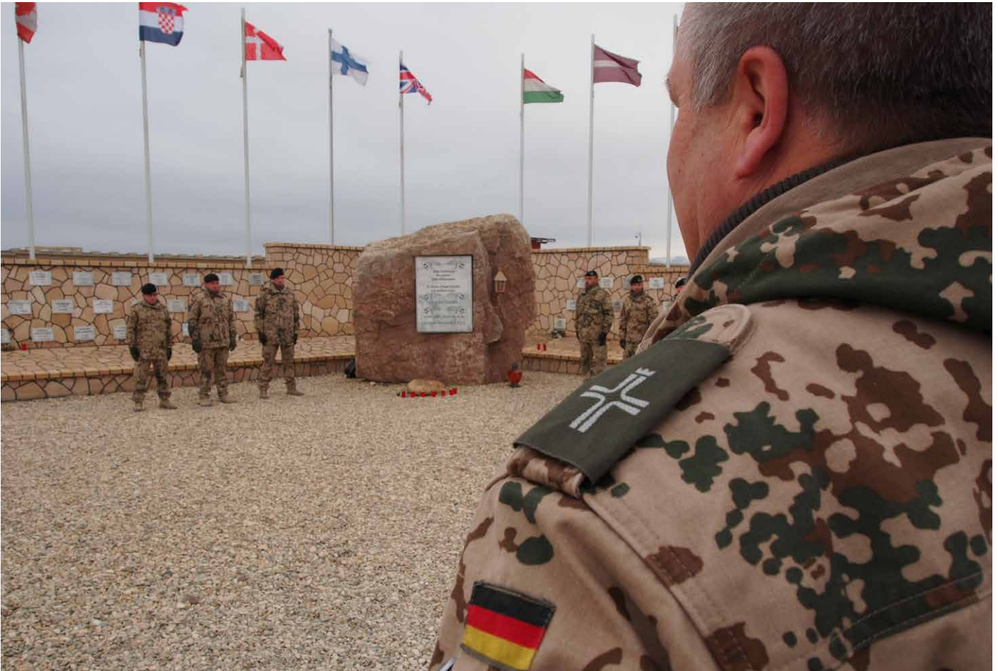
Ein katholischer Militärgeistlicher vor dem Ehrenhain für die gefallenen Soldat*innen im Camp Marmal in Masar-i-Scharif.