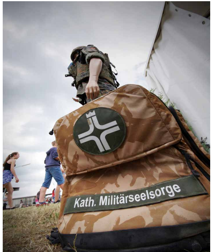
Die Militärseelsorge ist immer erkennbar.

der Militärpfarrer*in sprachen. Die meisten sprachen darüber mit Kameraden (66,7%) und Partner*in (36,1%). Auf die Frage, bei welcher Gelegenheit die Soldat*innen Militärseelsorger*innen antrafen, antworteten 27,7%, beim persönlichen Gespräch und 20,9%, bei „Öffentlichkeitsarbeit“ – darunter fallen Presse- und Rundfunkauftritte innerhalb des Lagers. Auf die Frage, wen die Soldat*innen bei familiären Problemen adressiert haben, antworteten 7,3%, dass sie sich an Militärseelsorger*innen wandten. Die meisten sprachen mit ihren Kameraden (55,3%). Nach dem Einsatz sprachen 1,8% mit dem/der Militärpfarrer*in über persönliche Eindrücke und Gefühle im Einsatzland. Auch hier sprachen die meisten mit Partner*in (67,6%) bzw. Kameraden (61,8%). 29