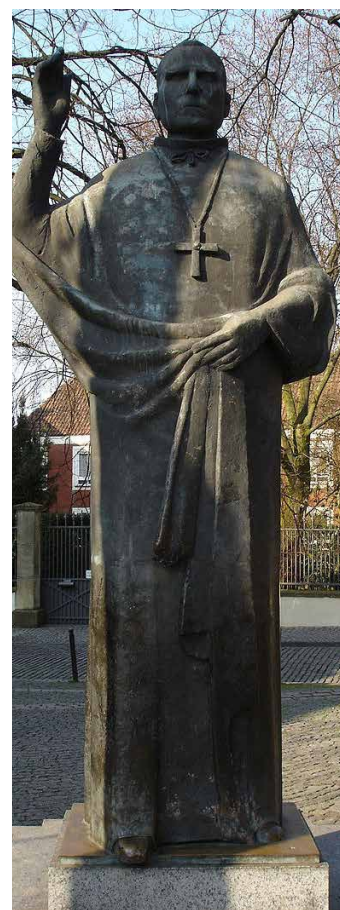
Statue von Bischof Clemens August Graf von Galen am nordöstlichen Ende des Domplatzes in Münster. Bischof Galen verkündete in seinem Hirtenbrief 1943: „Nach der Lehre des hl. Thomas von Aquin steht der Soldatentod in treuer Pflichterfüllung an Wert und Würde ganz nahe dem Martertod für den Glauben. ... Darum wird den christlichen Soldaten, die im Gehorsam gegen Gott aus Liebe zum Vaterland ihr Leben hingeben, ewige Herrlichkeit und Lohn zuteil werden, ganz ähnlich wie den hl. Märtyrern.“