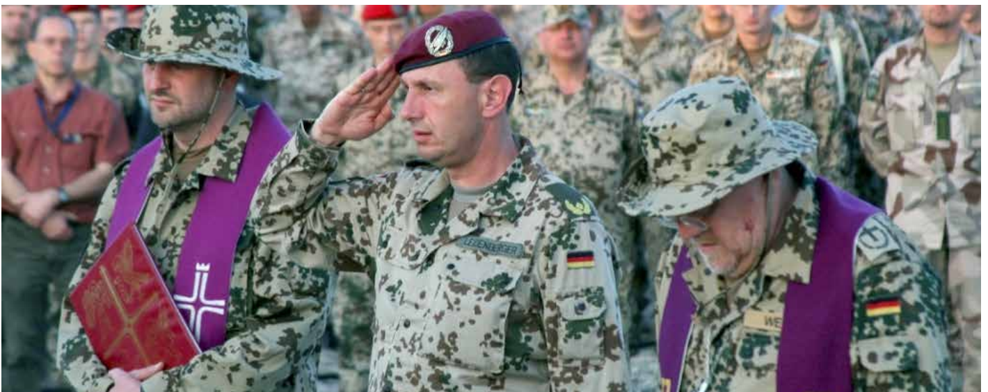
Militärpfarrer bei der Andacht.

Zusätzlich besagt Artikel 140 des Grundgesetzes, dass „soweit das Bedürfnis nach Gottesdienst und Seelsorge im Heer, in Krankenhäusern, Strafanstalten oder sonstigen öffentlichen Anstalten besteht, die Religionsgesellschaften zur Vornahme religiöser Handlungen zuzulassen [sind], wobei jeder Zwang fernzuhalten ist.“ Somit ist die Militär-