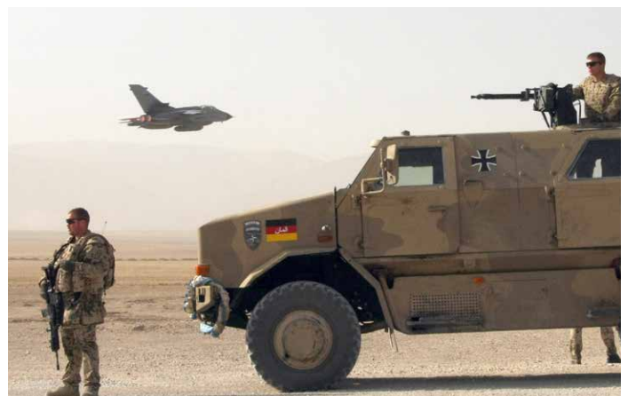
Objektschutzregiment der Bundeswehr in Afghanistan. Auf dem Einsatzfahrzeug ist das Bundeswehrkreuz deutlich zu erkennen.