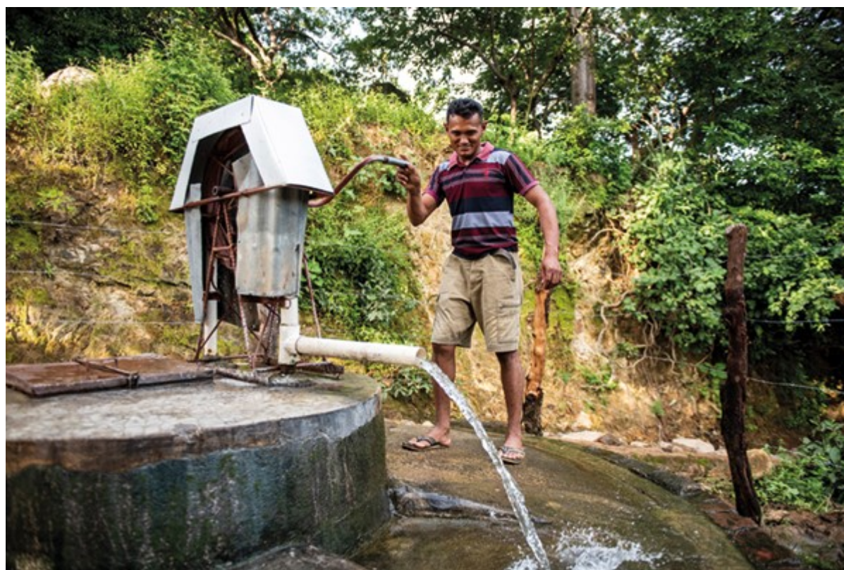
Die verbesserte Trinkwasserversorgung in Nueva Esperanza

Das Bauerndorf Nueva Esperanza im Süden von Honduras ist durch den Klimawandel bedroht. Die Dorfbevölkerung schöpft dank der Hilfe des SRK neue Hoffnung. Der Katastrophenschutz gibt den Anstoss für viele Verbesserungen des Alltagslebens, wie hier auf dem Bild die verbesserte Trinkwasser-Versorgung.