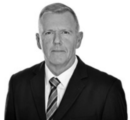
Dr. Erich Vad

Dr. Erich Vad Damit meine ich, wir müssen von einer wie auch immer gearteten späteren politischen Lösung zurückdenken und so agieren, dass spätere diplomatische Lösungen nicht verunmöglicht werden. Sie müssen für beide Seiten einen gesichtswahrenden Ausweg enthalten. Da sehe ich eine grosse Gefahr mit Blick auf die emotionsgeladene Debatte um Russland