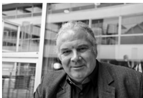
Andrej Hunko, MdB DIE LINKE

Zeitgeschehen im Fokus Was man in den letzten Wochen schon vor, aber insbesondere nach dem Beginn des Krieges in der Ukraine feststellen kann, ist die Abwesenheit von Diplomatie. Sie fehlt völlig. Warum hat man den Gesprächsfaden so achtlos fallenlassen?