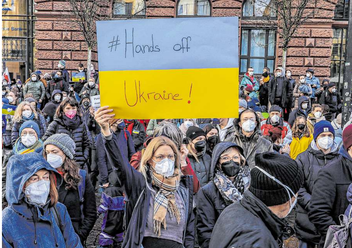
Mehr als 2000 Teilnehmer beteiligen sich an der Demonstration auf dem Domshof.