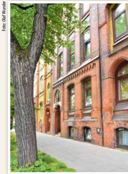
Bundesstraße 12: In diesem Haus wurde Ludwig Baumann geboren. Die Sedanstraße ist nicht weit entfernt.