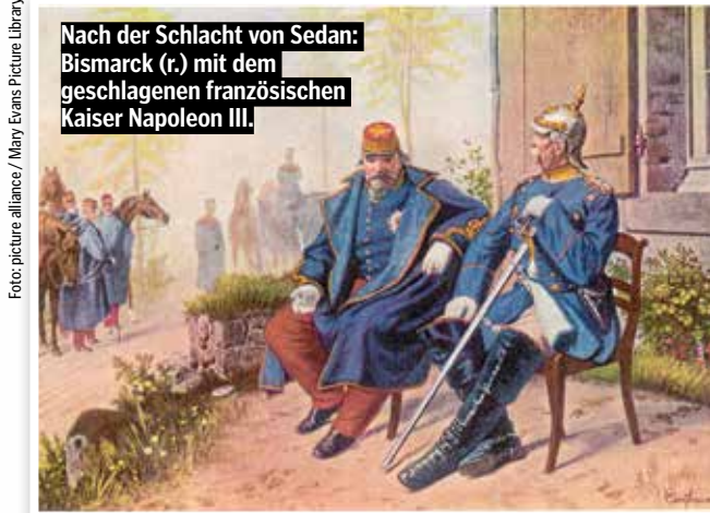
Nach der Schlacht von Sedan: Bismarck (r.) mit dem geschlagenen französischen Kaiser Napoleon III.

Klingt fast so, als würde sich die Angelegenheit noch etwas hinziehen.