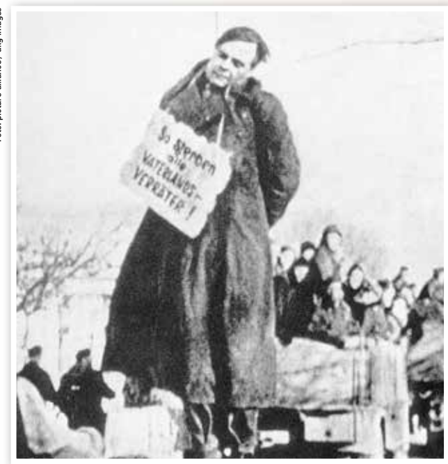
Kurz vor Kriegsende: Hier wurde ein Deserteur hingerichtet. Auf dem Schild, das um seinen Hals hängt, steht: „So sterben alle Vaterlandsverräter!“