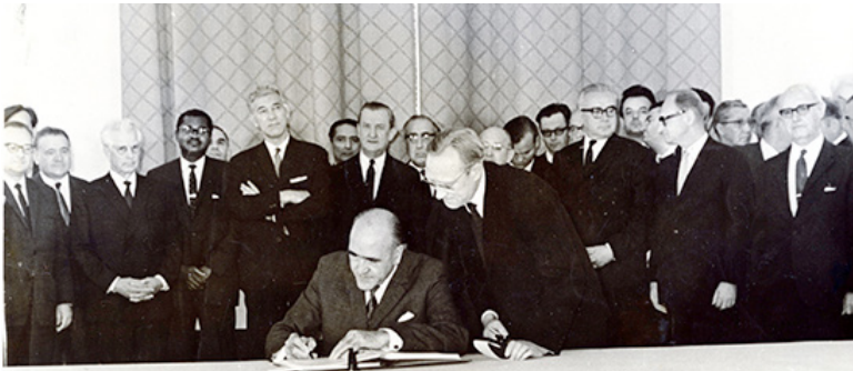
Minister Frank Aiken signing the Non-Proliferation Treaty (NPT) in Moscow, July 1968.

neralversammlung eine Arbeitsgruppe mit dem Auftrag ein, „konkrete und wirkungsvolle gesetzliche Maßnahmen, Vorkehrungen und Normen“ zum Erreichen und zum Erhalt einer atomwaffenfreien Welt“ zu untersuchen. Im August 2016 beschloss sie, in 2017 Verhandlungen zu führen über ein „völkerrechtlich bindendes Instrument zum Verbot von Atomwaffen, das zu ihrer vollständigen Abschaffung führt.“