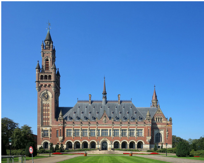
Internationaler Gerichtshof für Gutachten von 1996