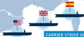
CARRIER STRIKE GROUP