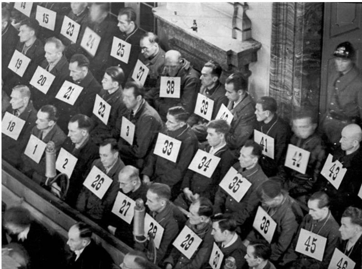
Bilder Nr. 183-V02830 und 183-V02838, CC BY-SA 3.0 de , Link , Link