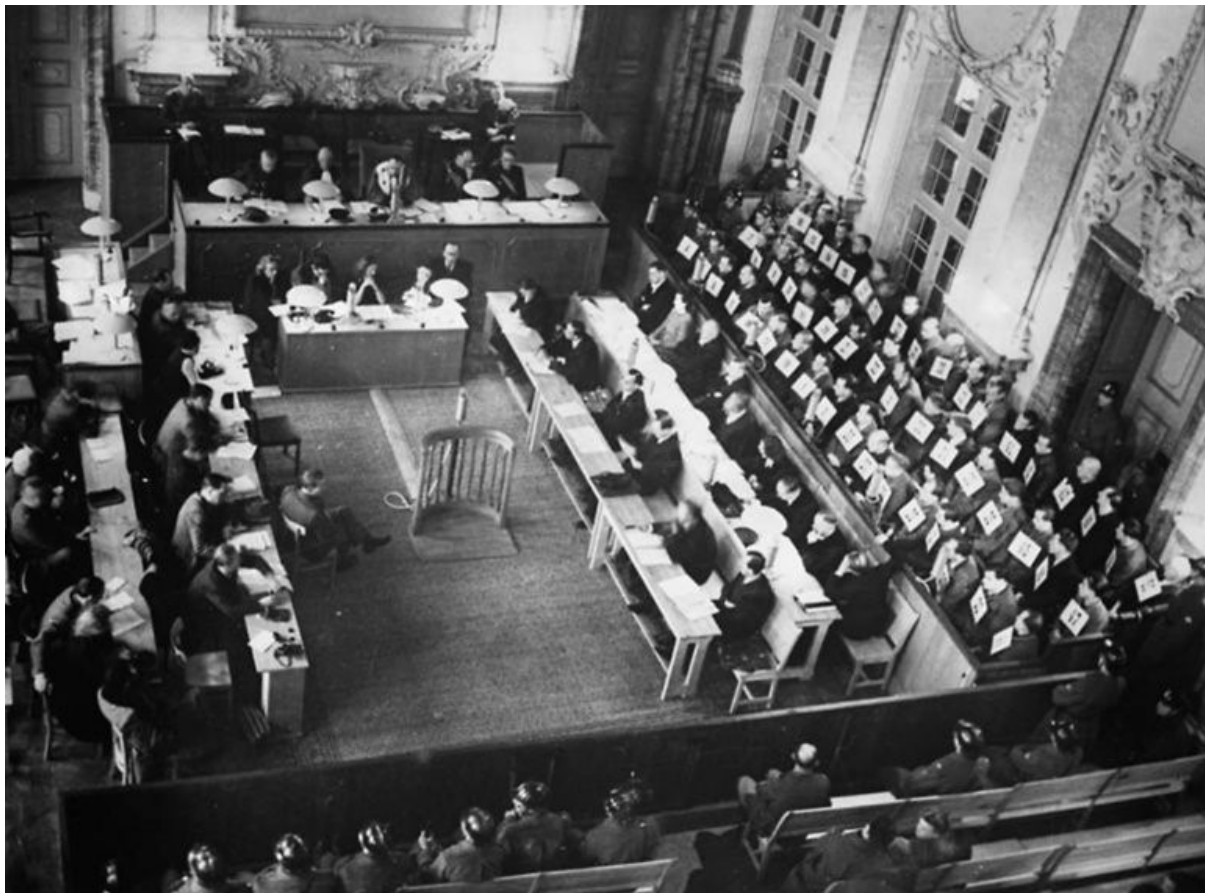
Das Tribunal Général im Dezember 1946.