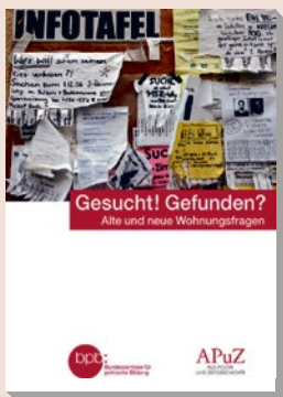
2019 Bestell-Nr. 10413