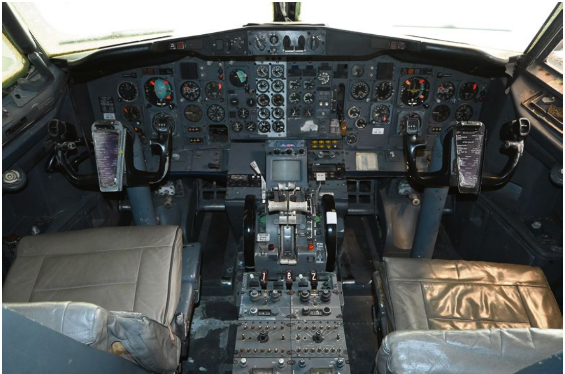
Das Cockpit der „Landshut“ von außen und innen, Mai 2021. © Sabine Dengel