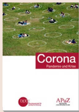
2021 Bestell-Nr. 10714