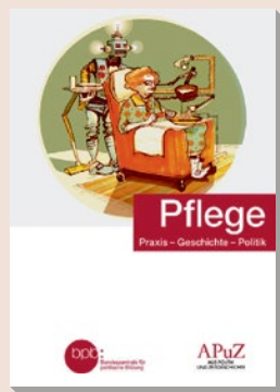
2020 Bestell-Nr. 10497