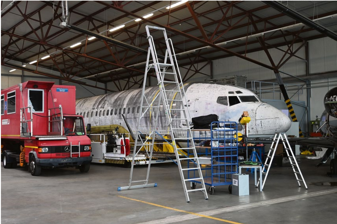
Die „Landshut“ in einem Hangar des Flughafens Friedrichshafen, Mai 2021.

visuellen Gedächtnis erklärt sich nicht zuletzt durch die wirkmächtigen Fernsbilder und deren wiederholte Reproduktion in Doku-Dramen oder Spielfilmen. 10 Eine weitere, wenn auch wenig bekannte, populärkulturelle Erinnerung stellt das 1996 unter dem Pseudonym „Baader Meinhof“ veröffentlichte Konzeptalbum des Sängers der britischen Bands The Auteurs, Luke Haines, dar. Die LP „erzählt“ in zehn Songs die Geschichte der RAF bis zum „Deutschen Herbst“ und enthält ein „Mogadishu“ betiteltes Lied. 11