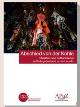
2021 Bestell-Nr. 10751

Hier für 4,50 Euro bestellen oder kostenfrei herunterladen