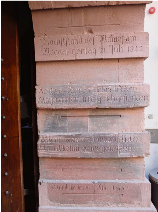
Hochwassermarken am Roten Bau des Alten Rathauses in Würzburg mit Verweisen unter anderem auf die „Magdalenenflut“ 1342 und die „Eisflut“ von 1784. Die älteren Hochwassermarken sind mit Sicherheit nicht zeitgenössisch, aber plausibel aus älteren Quellen rekonstruiert.