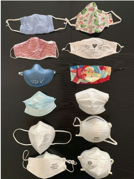
Einer von über 4000 Beiträgen aus dem Coronarchiv: „Masken-Evolution“ von Meike Mittmeyer-Riehl, © CC BY-SA 4.0, www.coronarchiv.de/item?id=15079 .

pen sind implizite kulturelle Muster, Denkge- wohnheiten, die auf noch nicht ausreichend er- forschten Wegen über das intergenerationelle Gedächtnis und die Medienkultur weitergege- ben werden.