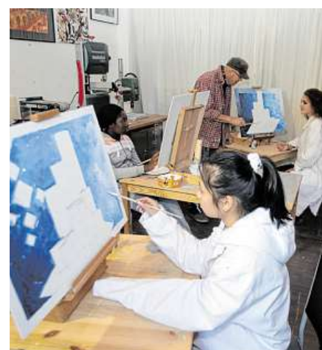
Ruhig und konzentriert geht es beim Malkurs im Glashaus Pusdorf zu.

Zuletzt wird die Gruppe ein freies Bild malen. „Ein Künstler muss ja auch seine Ideen reinbringen“, erklärt Saathoff, „sodass jeder seinen eigenen Stil entwickelt. Was die Jugendlichen später daraus machen, wird man sehen. Die Hauptsache ist aber, dass sie den Spaß am Malen nicht verlieren.“ Und Spaß scheint es den Teilnehmerinnen zu machen: