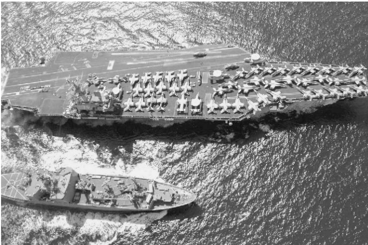
US-Flugzeugträger „Ronald Reagan“

von Erhard Crome, Politikwissenschaftler, Berlin