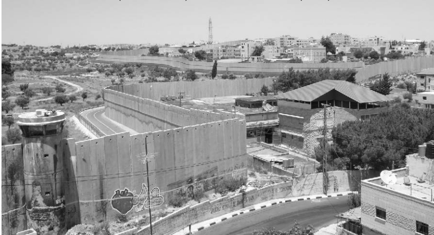
Foto: Bethlehem 2009 (rechts im Bild), Quelle: Paolo Cuttitta (Flickr)

schenrecht der Maßstab für die Beurteilung von Konflikten sind. Von daher sehe ich auch niemandem, der Palästinenser*innen die Menschenrechte abprechen würde. Im konkreten Fall wird es schwieriger. Es ist klar, dass die israelischen Siedlungen in den 1967 eroberten Gebieten völkerrechtswidrig sind. Ihre Unterstützung trägt zu einer Stabilisierung der Siedlungen und zu einer Verschärfung des Konflikts bei.