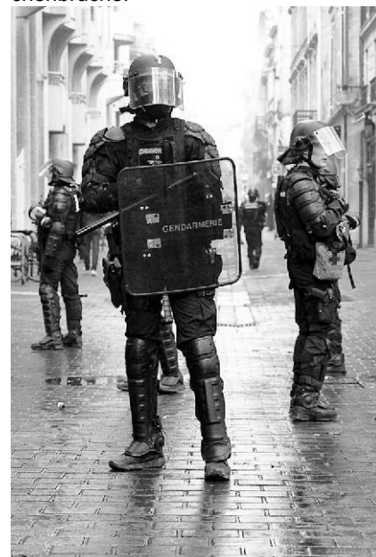
Les Gilets Jaunes, 19.1.2019

Einsatz von Schlagstöcken und Pfefferspray in einen engen Tunnel getrieben und dort von beiden Seiten her aneinander gedrängt; Betroffene beklagten akute Atemnot. Im weiteren Verlauf schlugen Beamte auf Bewusstlose ein und kippten einen Rollstuhlfahrer aus seinem Rollstuhl. Amnesty International dringt mittlerweile auf die Einrichtung unabhängiger Beschwerdestellen in puncto Polizeigewalt. Verlässliche Statistiken über Polizeigewalt in Deutschland liegen nicht vor. Für das Jahr 2019 zählt die Polizeiliche Kriminalstatistik 1.500 Fälle von Körperverletzung im Amt, von denen allerdings nur zwei Prozent zu einer Anklage und weniger als ein Prozent zu einer Verurteilung führten. Eine wissenschaftliche Untersuchung zeigt, dass lediglich 14 Prozent aller polizeilichen Übergriffe angezeigt werden - dies, weil die Opfer sich keine Hoffnung auf Erfolg machen. Dabei bestätigten in der erwähnten Untersuchung 71 Prozent der Befragten, Verletzungen erlitten zu haben; 19 Prozent nannten sogar schwere Verletzungen, etwa Knochenbrüche.