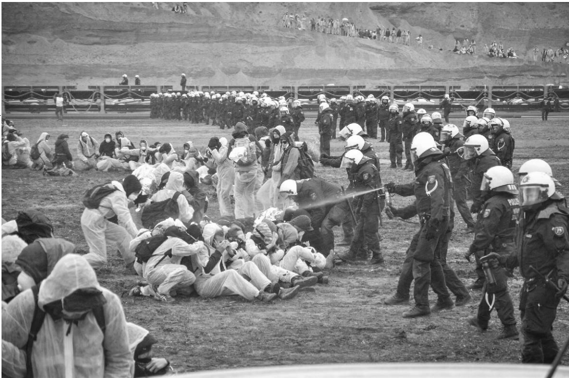
Foto: Vorgehen der Polizei gegen Sitzblockade von „Ende Gelände“ im Rheinischen Braunkohlerevier am 17.11.2017