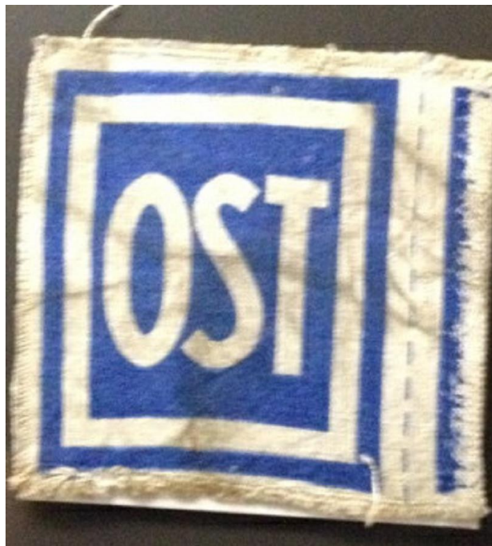
Kennzeichen 38 für Zwangsarbeiter aus der Sowjetunion 39