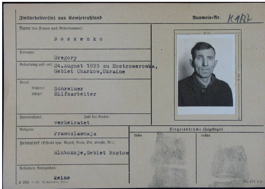
Gregory Bossenko, „Arbeitskarte“ Vorderseite