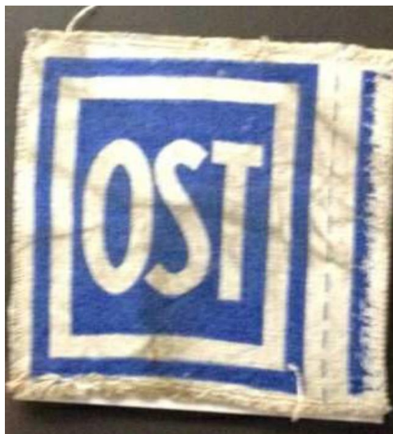
Kennzeichen „OST“ für Zwangsarbeiter*innen aus der Sowjetunion 12