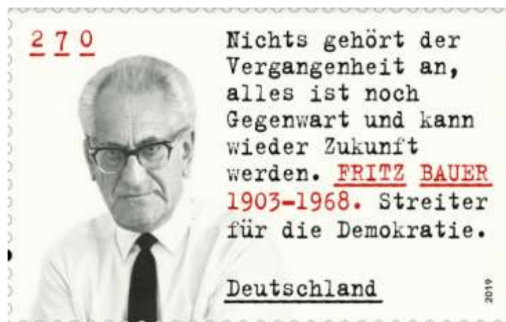
Briefmarke meiner Republik von 2019 30

Auch dadurch, daß sich der Reichsminister des Innern am 19.6.1942 an den Regierungspräsidenten in Minden wandte, um ihm mitzuteilen, was „zweckmäßig 27 “ sei 28 . Und der sich am 25.6.1942 an den Landrat in Büren wandte: die Abschrift sei „dem Stadt- u. Amtsbürgermeister hier zur Kenntnis und weiteren Veranlassung zu übersenden“ 29 . So daß der Regierungspräsident dann - nach einiger Korrespondenz - dem Landrat in Büren am 22.10.1942 den Bericht vom 21.9.1942 zusenden konnte – zur geflissentlichen Kenntnis – und „damit einverstanden“ war, daß die Gefangenen des „Konzentrationslagers“ und ihre „Todesursachen“ zu einem „Sonderfall“ wurden.