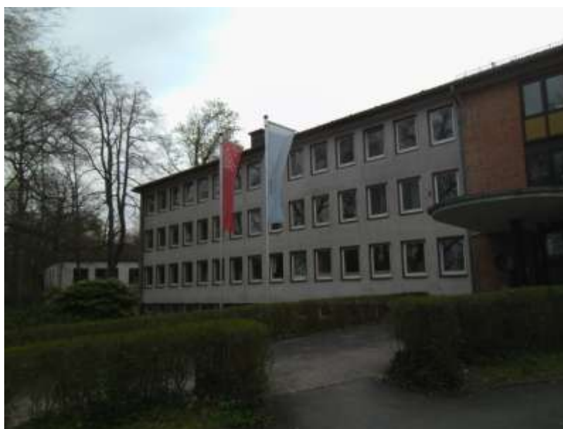
in Bad Arolsen (Photos von 2017)