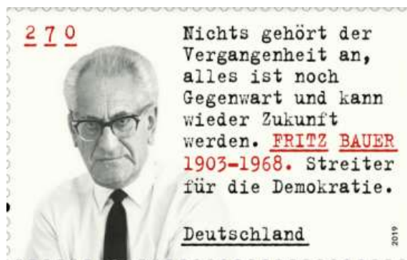
Briefmarke meiner Republik von 2019 32

„Handwerker siehst du, aber keine Menschen, Denker, aber keine Menschen, Priester, aber keine Menschen, Herren und Knechte, aber keine Menschen. “