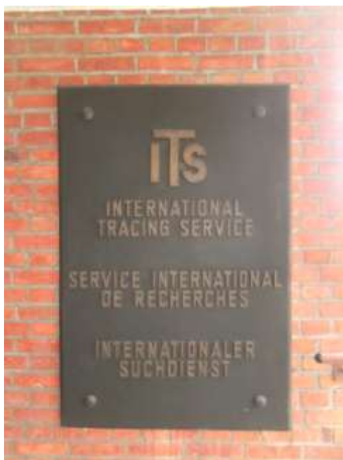
International Tracing Service 81 Service International de Recherches Internationaler Suchdienst 82