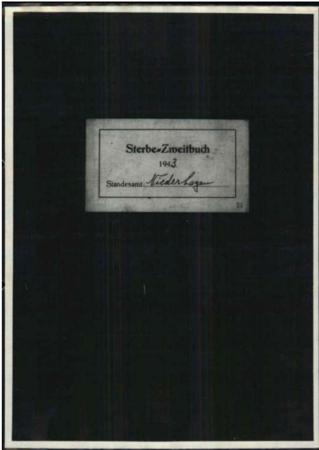
„Sterbe-Zweitbuch 1943 Standesamt Niederhagen“ 44

Weihnachten und Silvester 1942 sind vorbei; ein neues Jahr beginnt: