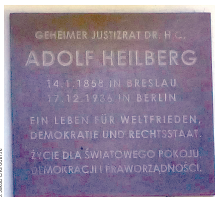
Am 30. Mai enthüllte Gedenktafel in Breslau