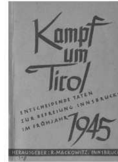
Abb. 1: Die Broschüre »Kampf um Tirol«, November 1945. Sie sollte den Beweis liefern, »daß ein österreichischer Widerstand vorhanden war«.