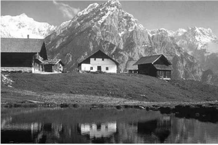
Abb. 5: Die Walderalm in der Nähe des Vomperlochs, undatiert. Hier sollten die Deserteure im April 1945 Waffenlieferungen des OSS entgegennehmen.