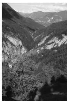
Abb. 3: Das Vomperloch im Tiroler Karwendelgebirge, undatiert

Abb. 2: Aus der Broschüre »Kampf um Tirol«, Seite 13, November 1945. Der Begriff »Deserteure« wurde vermieden, stattdessen war im Widerstandsnarrativ die Rede von »heimattreuen österreichischen Soldaten, die sich vom Hitler-Krieg losgesagt hatten«.